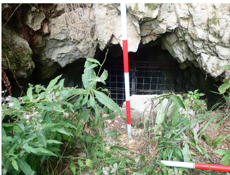
Obrázek 3. Dokumentace zajištění důlního díla ID 4858.