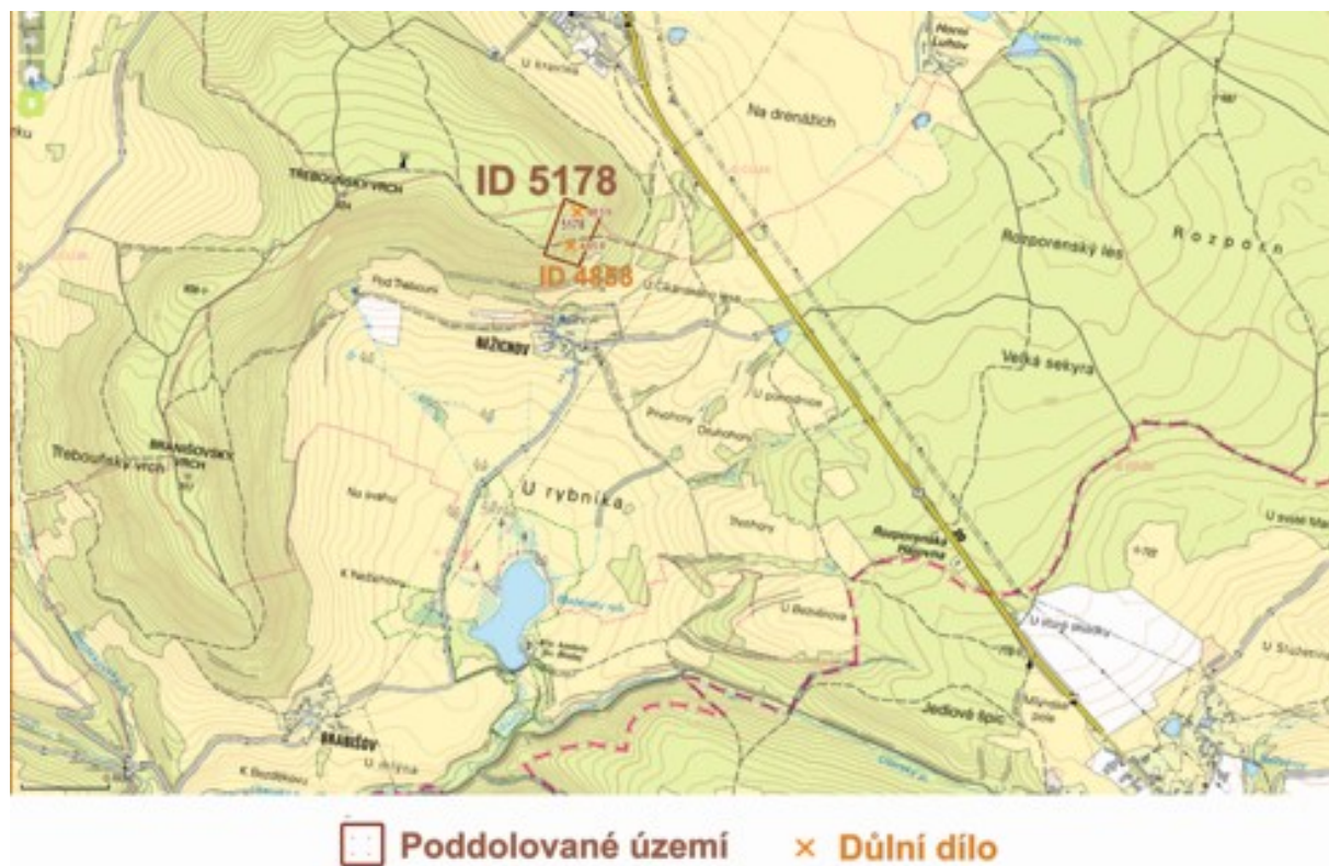
Obrázek 2. Rozsah poddolovaného území v širším okolí části zájmového území s vyznačeným zájmovým územím (© ČGS - SurIS 2021 a ČÚZK 2021).

dioaktivní suroviny. V tomto poddolovaném území jsou dvě důlní díla (Obr. 2). Z dostupného zákresu vnějších hranic komplexních pozemkových úprav není úplně jasné, jestli jižně ležící důlní dílo (štola Št-1; Obr. 3) ještě náleží řešenému území, nebo je tato plocha již z komplexních pozemkových úprav vyňata.